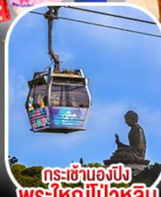
กระเช้าเองปิง พระใหญ่ไผ่หลิน